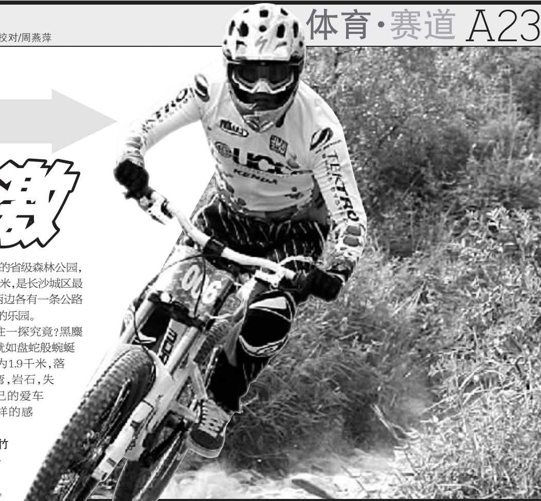
▲自行车速降很刺激。