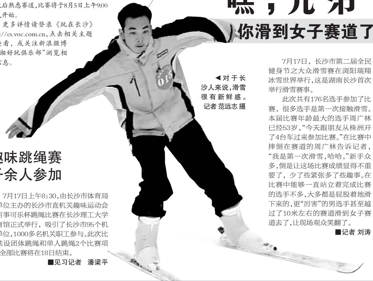
◀对于长沙人来说,滑雪很有新鲜感。

更多详情请登录《玩在长沙》 http://cs.voc.com.cn ,点击相关主题帖查看,或关注新浪微博“三湘好玩俱乐部”浏览相关信息。