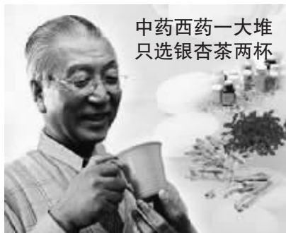
中药西药一大堆 只选银杏茶两杯

药王银杏茶，采用的银杏原叶全部采自于湖北随州洛河镇古老森林中的千年野生银杏树，药用价值极高。这些原叶都是厂家负责人绕过各种中间环节，8—9月份（黄酮含量最高）亲自从深山药农家中收购，决不以次充好，以确保产品的药效。