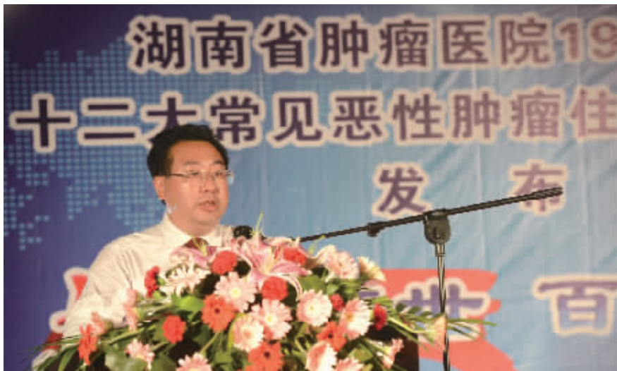
省肿瘤医院院长刘景诗博士在新闻发布会上发言。

胃癌等4种癌症,其他8种癌症的5年生存率均超过50%。据悉,该医院曾在上个世纪对1987至1991年治疗的8类恶性肿瘤病例做过同类分析,此次结果较上次相比较,各病种的生存率均有大幅提高。