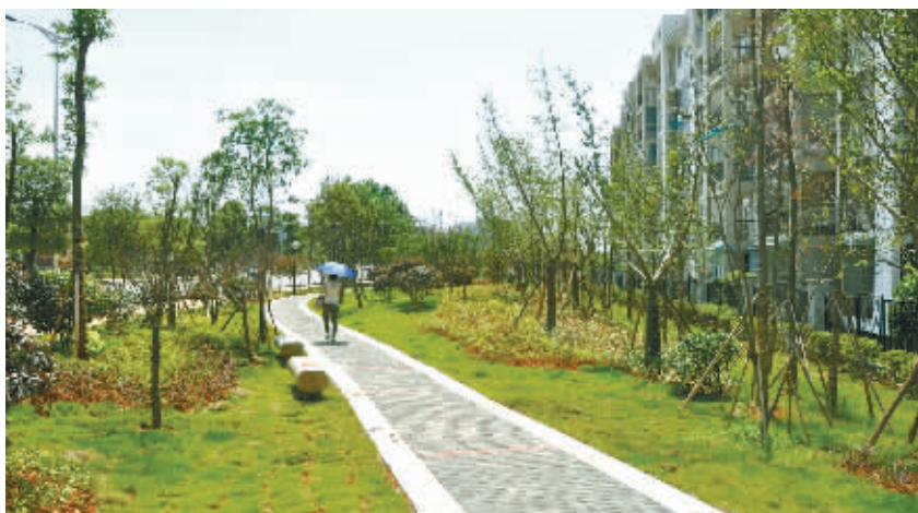
7月8日,新开园的九峰苑社区公园,这儿曾杂草丛生,一片荒芜。

最令人期待的,则是一年四季都可在公园内看到绽放的花儿:春天的樱花、紫薇、含笑,夏天的杜鹃、花石榴,秋天的桂花,冬天的茶花。沁人心脾的桂花和含笑,将让居民闻着花香带着一份好心情回家。