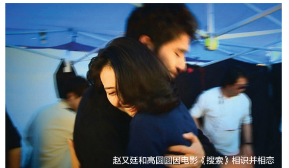
赵又廷和高圆圆因电影《搜索》相识并相恋

既然“遇见高圆圆，我很幸运，会经营这段感情”，那我们也祝福现年28岁的赵又廷能够早日和他的新娘携手迎接2014。