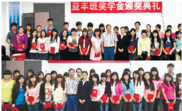
今年6月,常德职业技术学院“益丰药学大专班”奖学金颁奖典礼。