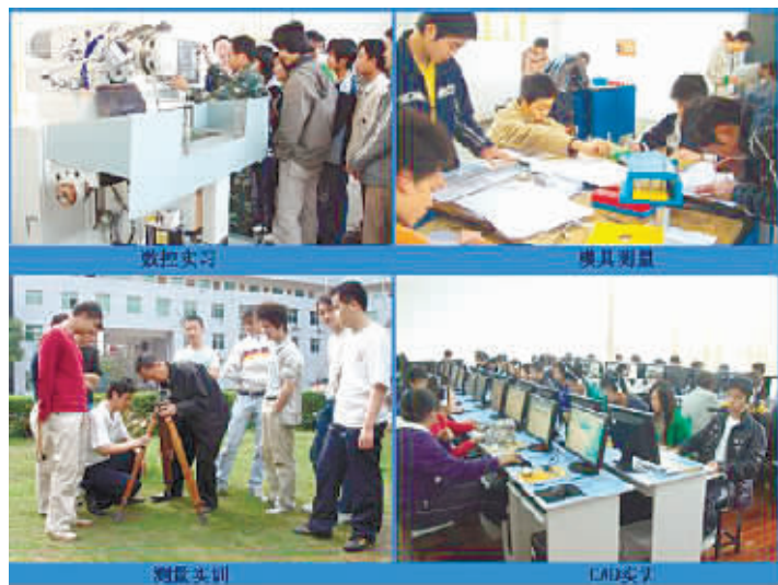
湖南有色金属职业技术学院学生参加实训。

学院还改革公务招待制度,实行招待费切块包干制。在学院每年的经费预算方案中,将公务招待费用切块到院领导个人,各二级机构的招待费也切块到相关部门,院领导和各部门的招待费包干使用,超支不补,结余留用。经过切块预算控制,学院全年只有40多万元的招待费。 ■记者 贺卫玲 黄京 实习生肖璐 高进 杨妍璐