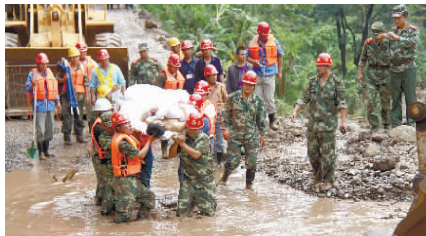
6月28日，白鹤滩突发泥石流，约40人失踪。

记者6月28日中午从四川省政府应急办获悉，当日6时14分左右，凉山州宁南县白鹤滩镇和保格乡境内因局地暴雨，在白鹤滩电站施工区附近发生泥石流灾害，已造成三峡公司白鹤滩电站施工区人员失踪38人至41人。