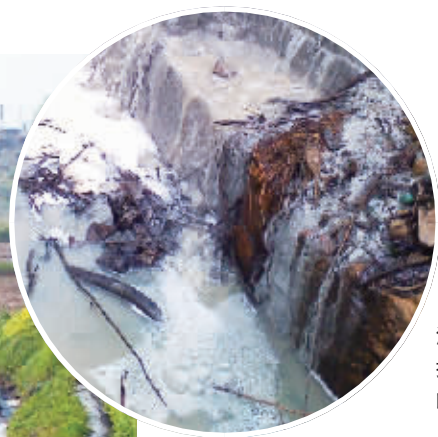
暗道排污口正在直排令人恶心的废水。