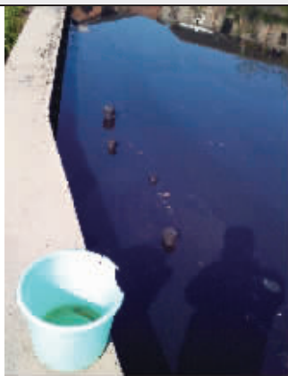
泥鳅放入鑫龙公司排出的废水中,30分钟就死亡了。

离邵东县余田桥镇上不足1公里的渔西村,以盛产马蹄、萝卜出名,因为品质好,这些土特产都是抢手货。尤其是马蹄,很多商贩为了多拉货,总是走家串户亲自跑到村民家收购,然后批发到全省各地。不过这一景象5年来已不复存在。