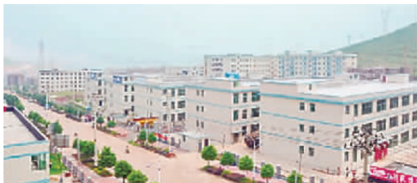
桂阳县工业园内整齐大气的厂房。(资料图片)

标准厂房建设中,桂阳采取“政府推动、系统开发、市场运作、政策扶持”的方式,把任务分解到县直有关部门、单位,要求限时完成,并大力引导个人或法人以多