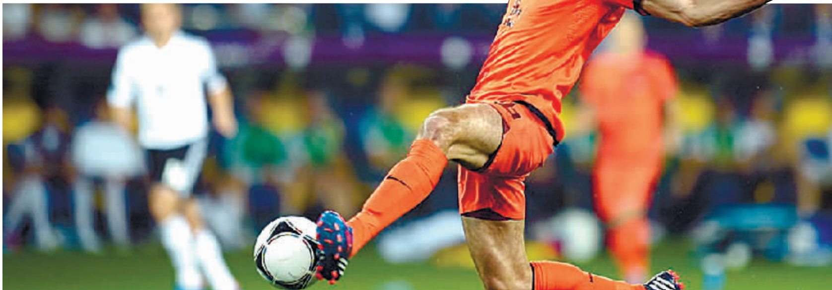
范佩西领衔的荷兰再不自己飞起来就要坐飞机飞回家了。

6月14日凌晨,在欧洲杯B组第二轮比赛中,葡萄牙3:2战胜丹麦队,荷兰队则以1:2不敌德国队。目前德国队两战全胜积6分,葡萄牙和丹麦各积3分,世界杯亚军荷兰队竟然吃了鸭蛋。但由于本组球队实力都很强,最后一轮胜负难料,暂列第一的德国队也有可能出局,1分未得的荷兰队也有机会出线,这一组已经乱成了一锅粥,不过最难熬的还是荷兰。