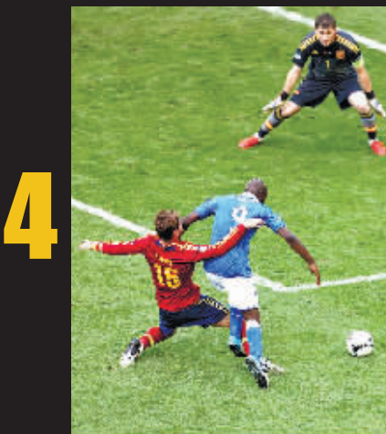
他真正做到的是：等等吧，等等后面那家伙。