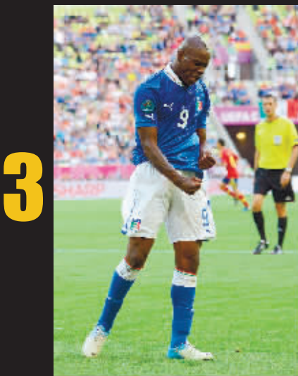
他自己心想：一会，应该这样庆祝。