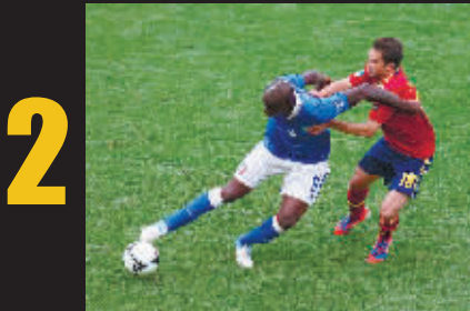
对手以为：这家伙又要撒丫子狂奔了，撵不上啊。