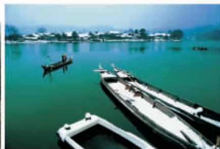
▲ 渔舟唱晚