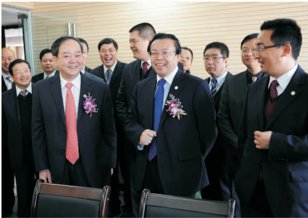
▲ 欣喜笑容—中国华融资产管理公司总裁赖小民(前中)在华融湘江银行董事长刘永生(前左)、行长雷志平(前右)的陪同下深入华融湘江银行长沙分行调研