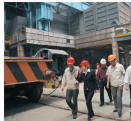
▲ 客户至上—华融湘江银行分行树立以客户为中心理念，与客户建立良好合作关系。