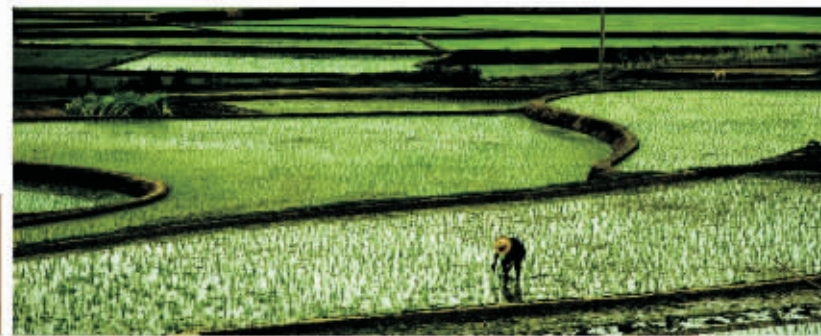
▲ 山野春曲