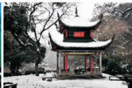
▲ 爱晚瑞雪