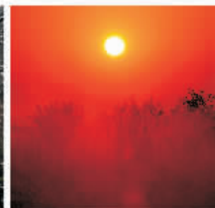
▲ 红日普照