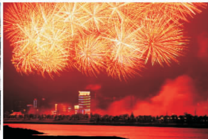
▲ 璀璨湘江