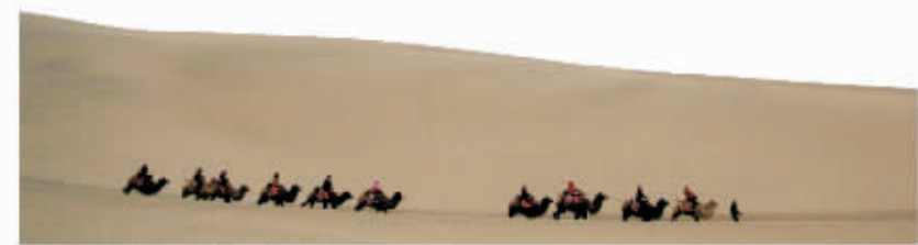
▲ 鸣沙山行