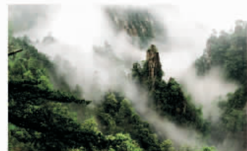
▲ 茶山仙境