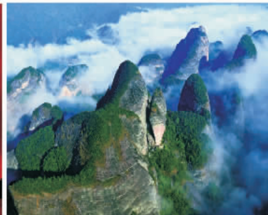
▲ 闹海蛟龙