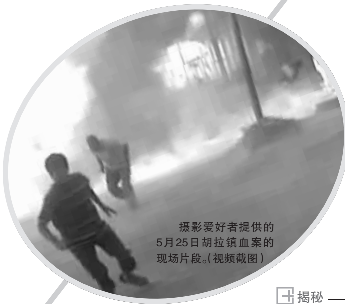
摄影爱好者提供的5月25日胡拉镇血案的现场片段。(视频截图)

美国白宫发言人杰伊·卡尼29日表示，目前，使叙利亚局势进一步军事化不是合适的选择，军事干涉将导致“更大的混乱和更多的屠杀”。