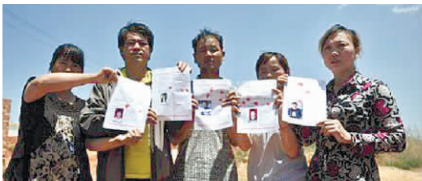
5名家属手持签字画押的情况说明,称自己的孩子离奇失踪。