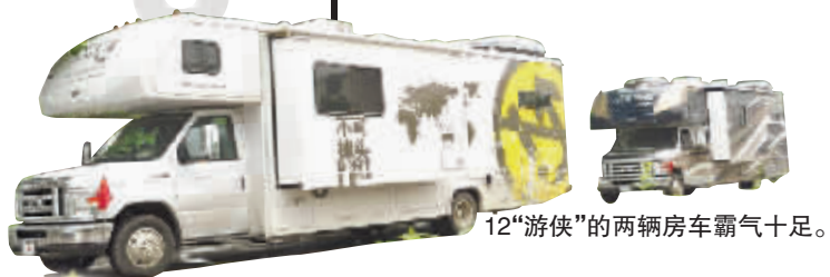
12“游侠”的两辆房车霸气十足。

●5月11日,3名英国年轻人乘出租车回到英国首都伦敦,创下行程约6.97万公里的出租车环游世界新纪录。三人于去年2月结伴驾驶一辆改装出租车开始环游世界。出租车里程表显示“的费”79006.8英镑(约合12.69万美元)。