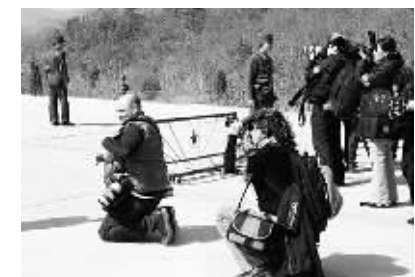
正在现场采访的各国媒体记者。

韩国政府一位官员9日在接受韩联社采访时说，朝鲜已将火箭运抵发射台，正准备加注燃料。注射燃料一般需要2-3天的时间，因此朝鲜可能从9日或10日开始加注燃料。