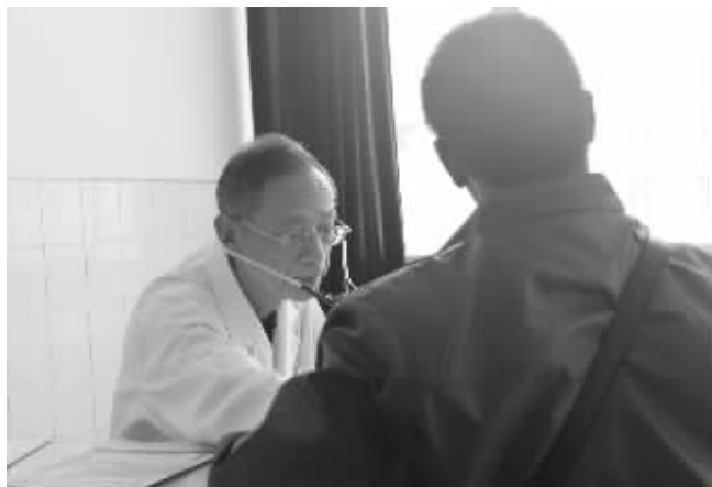
武警湖南省总队医院细胞刀专家为慕名而来的患者看诊。