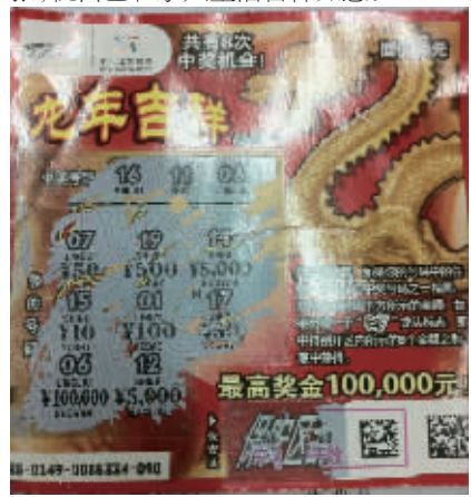
长沙“龙年吉祥”10万元大奖中奖票。

“龙年吉祥”是顶呱刮在龙年推出的一款“贺岁票”，票面金龙闪耀、大红灯笼高挂，非常喜庆吉祥。它共有9个奖级，最高可中10万元大奖。喜欢顶呱刮的彩民朋友今年可不要错过这款票，刮上几张，祝自己和家人生活吉祥如意！