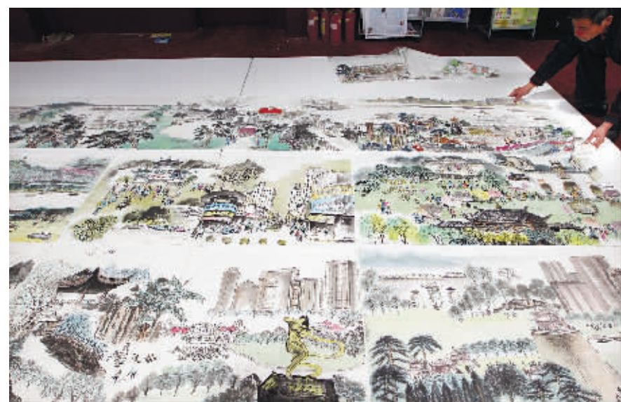
3月21日,由5位长沙画家历时两个月创作的《新长沙清明图》完成并正式亮相。《新长沙清明图》由17幅图景组成。