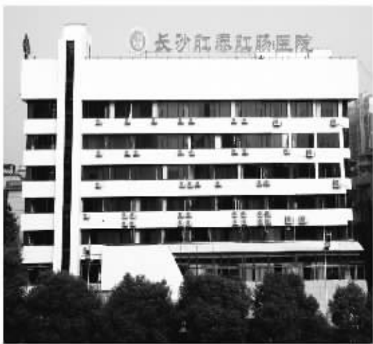
医院门诊大楼实景拍摄