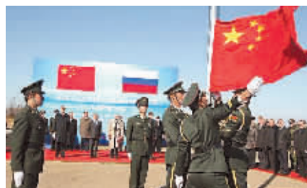
2008年10月14日,中俄在黑瞎子岛上举行界碑揭牌仪式,标志着两国边界线全部确定。黑瞎子岛见证了中俄关系的变迁。(资料图)