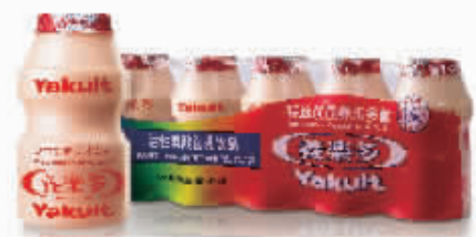
图为养乐多活性乳酸菌乳饮品

养乐多(中国)投资有限公司长沙分公司的负责人向笔者透露：“养乐多长沙分公司成立后，产品铺货范围更广，市民购买养乐多会更方便，很快在新一佳、王府井、平和堂、沃尔玛、家乐福等大卖场及中小便利店的乳制品冷藏区都能买到。为更好保持益生菌的活性和数量，产品建议在2-10℃低温冷藏，无需吸管，打开后即可直接享用。”