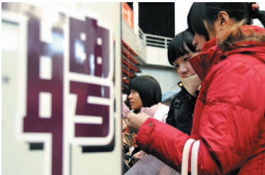
招聘会现场,应聘者正检查着自己手中的简历。

工作经历。应当包括你所有的工作历史,无论是有偿的还是无偿的、全职的还是兼职的。在保证真实性的前提下,尽量扩充与丰富你的工作经历,但用词必须简练。不