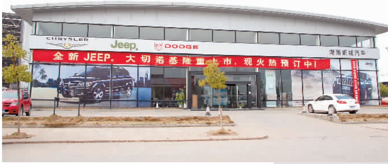
▲湖南津湘投资有限责任公司旗下子公司湖南Jeep-克莱斯勒新城店。