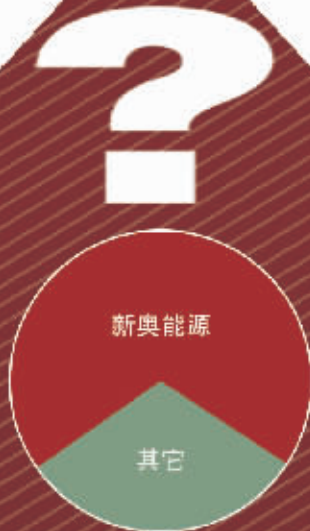
■新奥收购中国燃气后，几家企业占有的市场份额