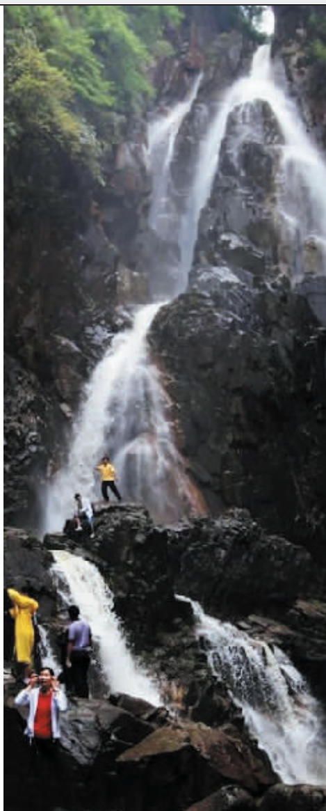
美景只有亲自去了才能领略到。