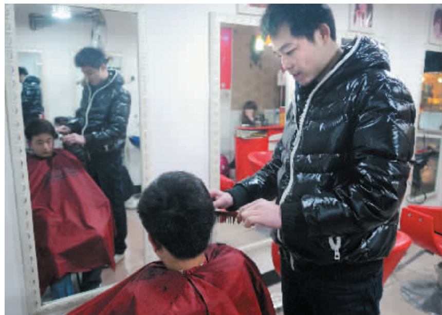
2月5日,长沙市蔡锷路某理发店,虞老板说以前是学徒交学费,现在给学徒发工资,请员工也得两千元一个月,所以只好自己上阵。