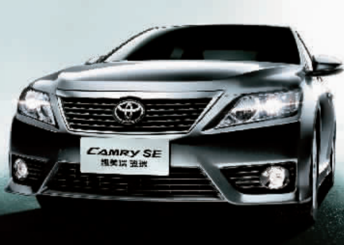
CAMRY SE 凯美瑞 逸致