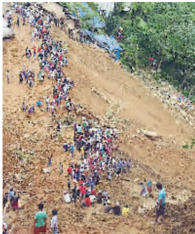
滑坡事故现场。

警方说,山体滑坡发生在5日黎明时分。6个小时后,在瓦砾堆中发现25名遇难者的遗体。孔波斯特拉省政府说,据信超过100人仍埋在泥土、岩石和瓦砾下。