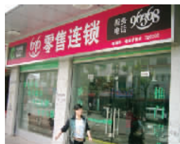
▲ 636 零售连锁其中一家店

这一举措，为众多的采纳优选购者提供了方便性，众多的采纳优用户在家门口即可享受到这一高端好礼给自己带来的尊崇享受。