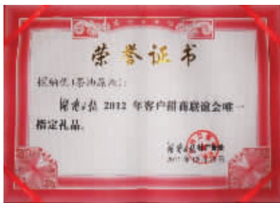
▲ 湖南日报社颁发的荣誉证书

1 月 4 日，贺龙年货节开始当日，截至上午 11 点，即完成采纳优订单 120 余套，公司兑现至尊红包 24000 余元。