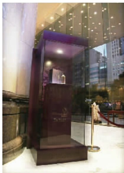
▲通程国际大酒店的采纳优

继通程采纳优圣诞之夜成主角后，近日中南油茶与长沙 636 零售连锁强强联合，同时中南油茶推出“1000 万元至尊红包大拜年”活动，再推采纳优过年好礼采购新高潮