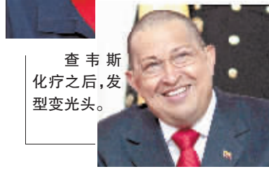
查韦斯化疗之后,发型变光头。

美国媒体29日报道,美国国务院对委内瑞拉总统查韦斯有关美国利用特殊技术诱使拉美国领导人患癌的说法予以驳斥,称查韦斯的言论“应当受到谴责”。