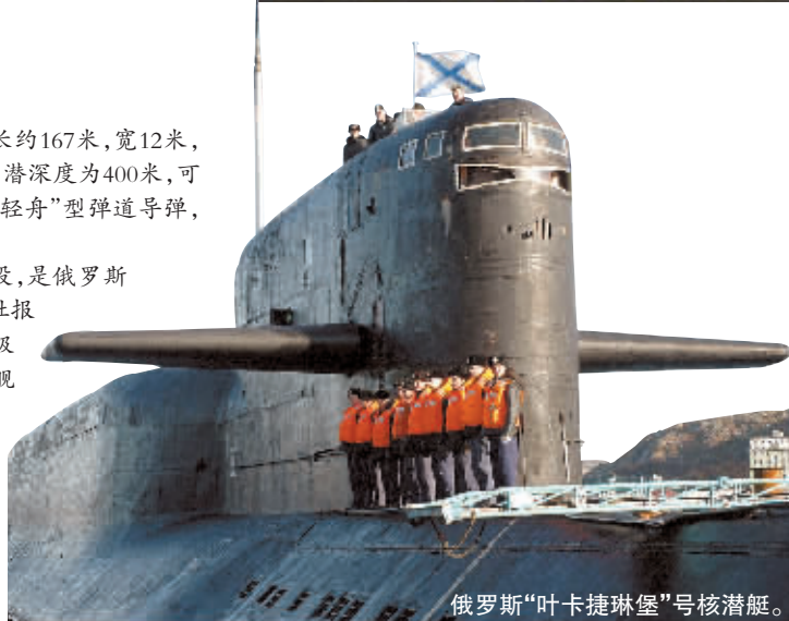
俄罗斯“叶卡捷琳堡”号核潜艇。

2000年8月,“奥斯卡II”级核潜艇“库尔斯克”号参加演习时在巴伦支海爆炸沉没,118名官兵全部丧生,是北方舰队近年来最惨重潜艇灾难。