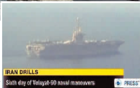
▶12月29日伊朗新闻电视台的电视截图显示,一艘美国航母出现在邻近霍尔木兹海峡的“在演习区域内”。

伊朗一名军方官员29日强硬回应美国涉及伊朗封锁霍尔木兹海峡可能的警告:对伊朗发号施令,美国“不够格”。