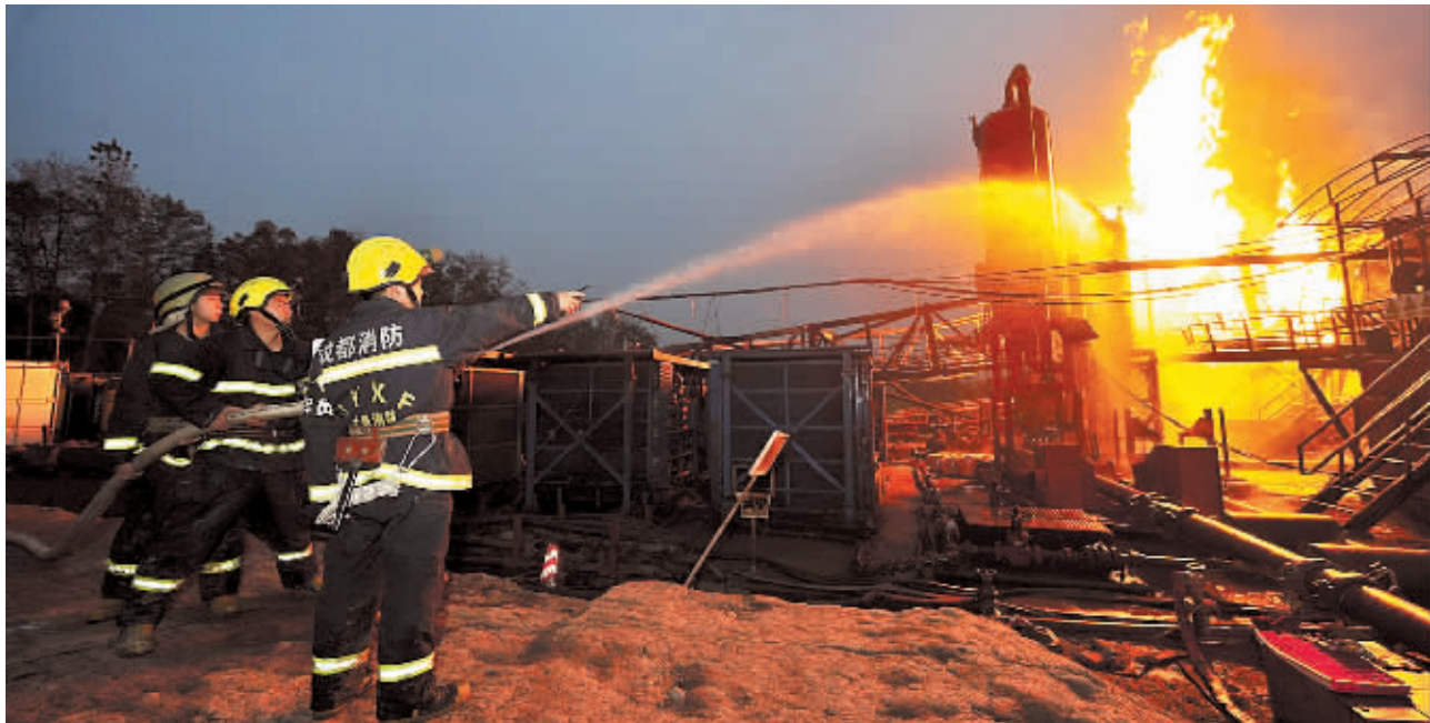
12月22日,成都消防支队官兵正在灭火。