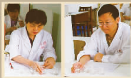
全国评酒委员、著名白酒专家 吕相芬