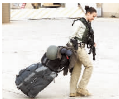
搬运行李准备离开。