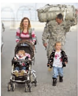
贝尔维一家的团聚。