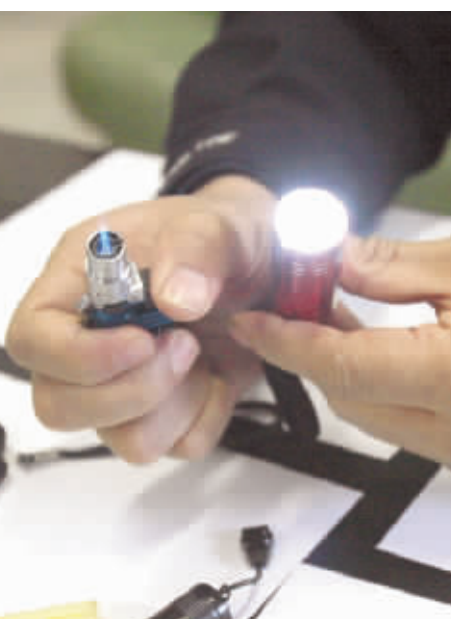
民警展示犯罪嫌疑人盗窃车内财物时所用的作案工具。

芙蓉巡警委托本报转告大家:这个团伙在长作案9起 最近5月有类似被盗车主,请拨0731-84782410询问