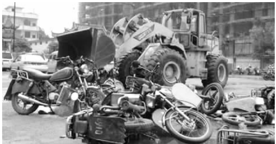
12月1日，嘉禾县公安局交警大队一中队对56台无牌无证、假牌假证和报废摩托车集中销毁。这些车是今年4月至11月交警部门查扣的。