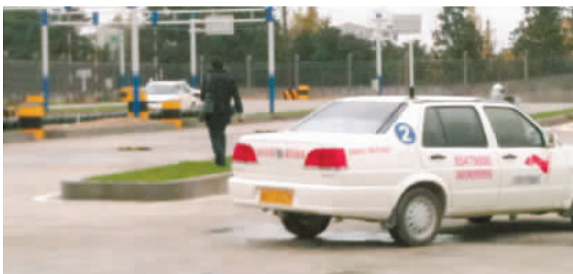
11月30日上午,远征驾校科目二考场内,20余名教练员坐上了考试车参加考核。

“当了10年教练,当一回考生还蛮紧张。”11月30日上午,远征驾校的20多名教练员坐上了考试车考生位置,监考官位置上则坐着长沙市交警支队驾管科民警和长沙市驾培处的负责人。为了提高驾校培训质量,提高待考学员考试通过率,杜绝教练员索费行为,长沙交警将在长沙市各个驾校中开展教练员考核,不但要考驾驶技能和教学能力,驾驶陋习、廉洁诚信也是此次考核的重点。