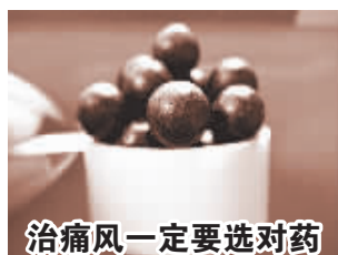
治痛风一定要选对药

科技发展到今天，患者不用去医院打针吃药就能治好痛风。【乌木甘】自上市以来，短短时间已让