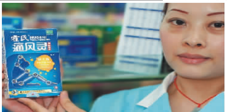
▲最新研制的痛风凝胶,不吃药治痛风获国家专利

堂药房、芙蓉区:火车站阿波罗药柜、湘湖大药房、火星镇楚济堂、雨花区:红星步步高超市药柜、天心区:平和堂(五一店/东塘店)、南门口好又多药柜、王府井负一楼药号、岳麓区:河西通程新一佳药号、康寿大药房(西站/赤岗冲店)、开福区:东风路楚仁堂药房、星沙:旺鑫大药房、浏阳:钰华堂大药房、望城:工农大药房、宁乡:开发药号、星沙:旺鑫大药房、株洲:贺家