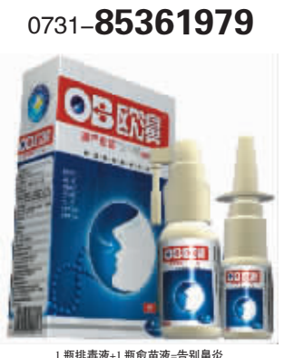
1瓶排毒+1瓶疫苗=告别鼻炎 提示:包装封口贴有防伪标签,如有撕毁视为已使用,不予退货。

潭:基建营福顺昌医药堂、常德:武陵阁大药房、岳阳:为民药店(九龙商厦对面)、益阳:平和堂大药房、衡阳:同健大药房、娄底:天天好大药房、郴州:同仁药店、永州:冷水滩五洲大药房、吉首:博爱大药房、怀化:东方大药房都已引进“瑞士欧澳”,鼻炎患者直接前去购买。也可拨打订购热线: 0731-85361979