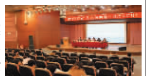
君碧莎红草止鼾胶囊科研成果研讨会会场(图)

界睡眠呼吸研究中心、中国中医研究院联合组成的科研专家组,经过11年的刻苦攻关,经现代最先进的科技萃取制药技术精制而成,能从根本上治疗打鼾及其所诱发的高血压、心脑血管、心肌梗塞等并发症,从而预防猝死的悲剧发生。服用红草止鼾胶囊3—6天,鼾声变小、呼吸暂停现象基本消失,18天以后呼吸通畅,打鼾消除,睡眠沉静,两个疗程基本治愈打鼾。经20多所科研机构在北京、上海十多家三甲医院3780名患者的严格临床检验,疗效卓越,安全可靠,国家卫生部、药监局直接审批为国药准字Z20080494,并纳入国家药典核心用药。