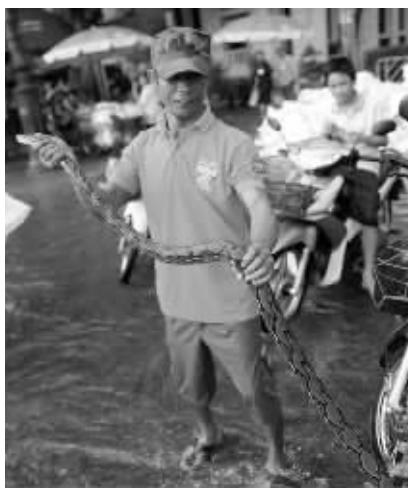
10月28日,泰国首都曼谷,一名出租车司机在大皇宫外的洪水里捕获了一条蟒蛇。

澳大利亚政府方面,基础设施建设和交通部称将采取行动干预澳航因罢工而停飞所有航班。