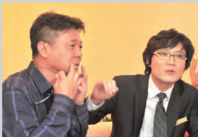
情歌王子姜育恒在 Yestar 咨询面部除皱