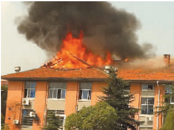
▲网友拍摄的中南大学实验楼楼顶燃起熊熊大火。

2010年1月3日下午5时左右,中南大学本部一幢3层砖木结构的办公楼起火,大火持续将近5个小时,先后有两拨消防队员赶往现场扑救。幸运的是,因为元旦放假,这幢起火的办公楼基本上是空的,没有人员伤亡。