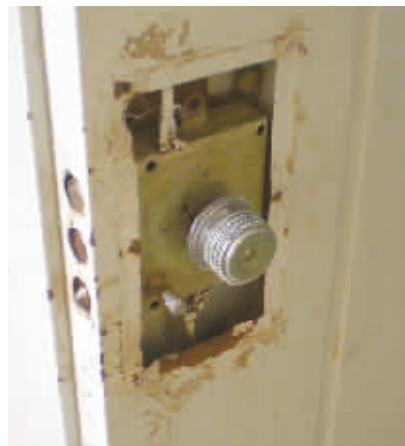
湖南师大天马学生公寓,宿舍的门被小偷撬坏。

就在对面的湖南大学天马公寓,记者发现,各个宿舍出人都得刷卡,一名宿管阿姨说,只有住在本栋楼内的同学用校园卡才能刷卡,而且每个寝室设有保险箱,24小时寝室有人值班,在门口还竖了一个醒目的牌子:凡