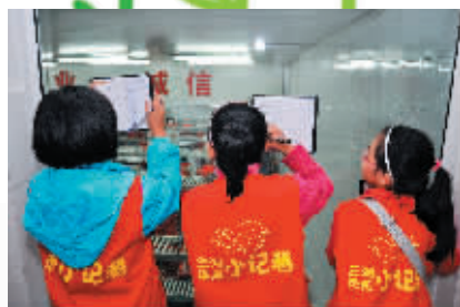
三湘华声小记者参观双汇集团河南总部。