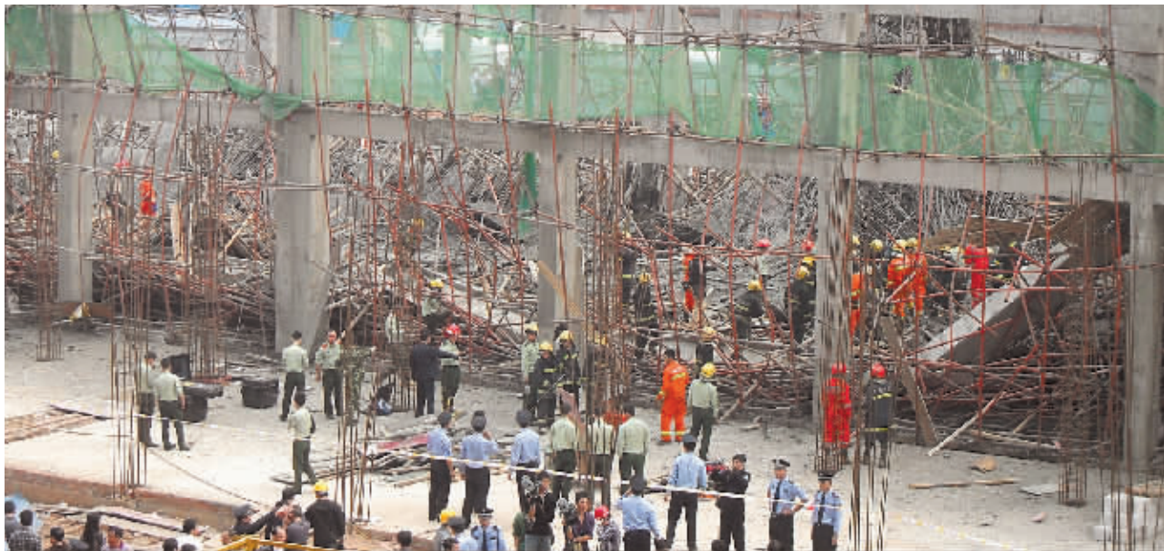
车间楼面坍塌现场,消防官兵正在搜救被埋工人。