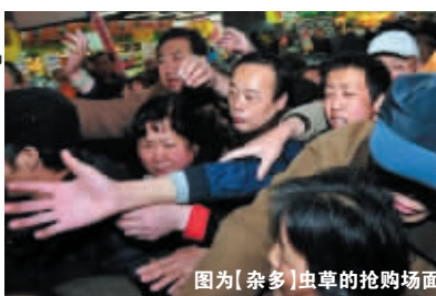
图为【杂多】虫草的抢购场面

已经有整整 3 个月了, 青海【杂多】牌冬虫夏草的热线电话每天都是从早到晚的从不间断的响个不停: “‘杂多’虫草还有优惠么? 我再订 20 盒, 上次买的才吃了一个礼拜, 确实管用……” “我订的 20 盒, 今天下班前可一定要送到啊……” “我的糖尿病 20 年了, 没想到吃虫草 2 个月并发症就都稳定了, 真得好谢谢你们啊, 我一定义务帮你们做宣传!”