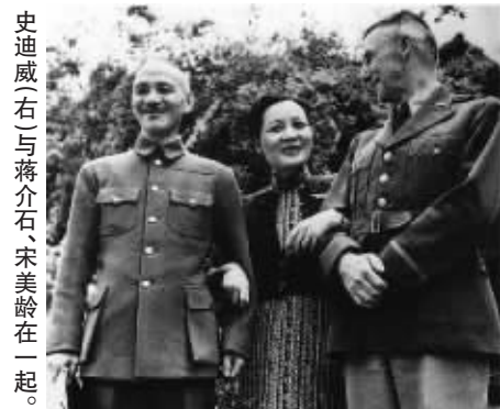
史迪威与蒋介石、宋美龄在一起。