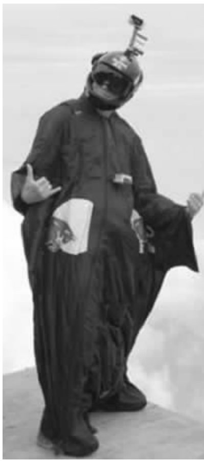
杰布试飞前给自己鼓劲。