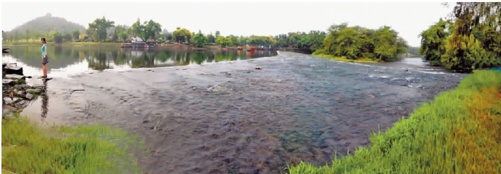
广西灵渠公园,湘江源头的水清澈无比。