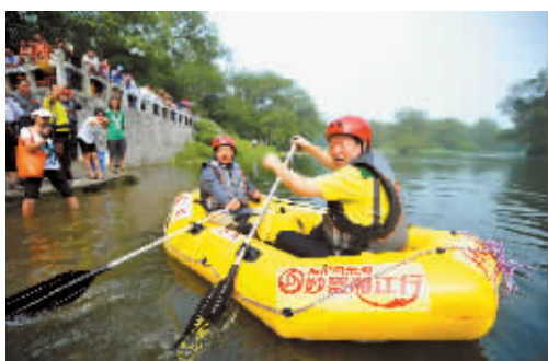
9月4日,广西灵渠公园,湖南省人大常委会副主任蒋作斌亲下水试漂。

跨越817公里激流险滩、历经17天风吹雨打,从涓涓细流的湘江源头海洋山到烟波浩渺的八百里洞庭湖,38名漂流勇士和11名环保卫士水陆并进,风雨兼程,用心感受、触摸,拥抱这条哺育着4000多万三湘儿女的母亲河。